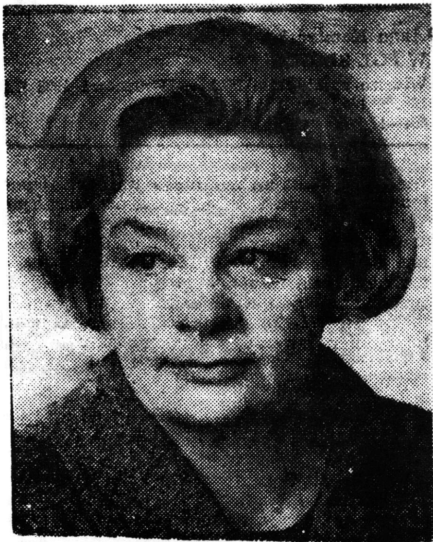
Miss [Name] [Title] [Institution] [Address] [City] [State] [Zip]